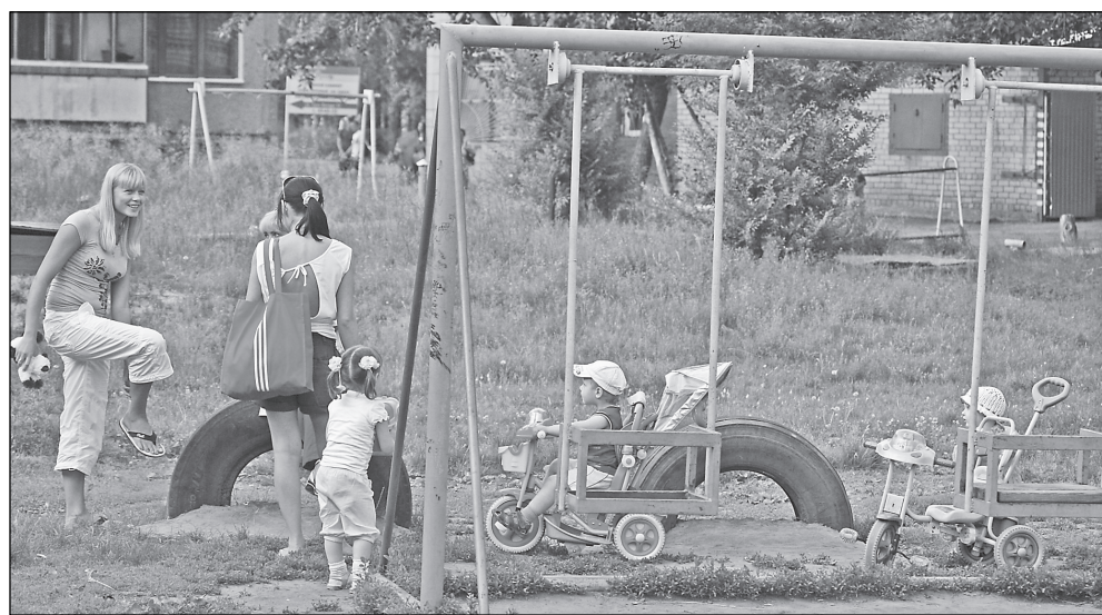
Рядом с турниками есть место и для малышей. Мамы с детьми приходят сюда из соседних дворов.