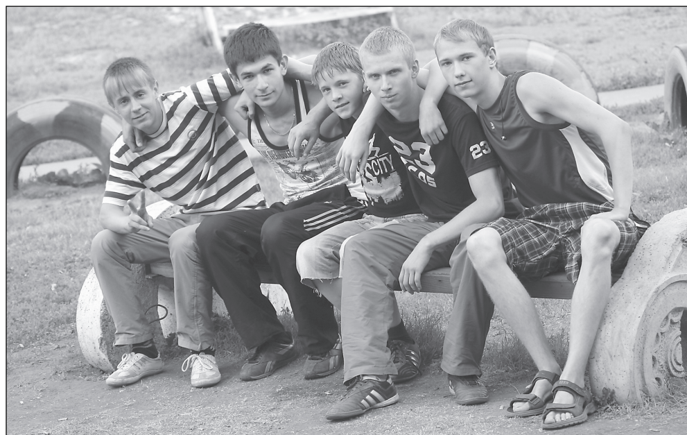
Эти пятеро парней – завсегдатаи спортивного пятачка.