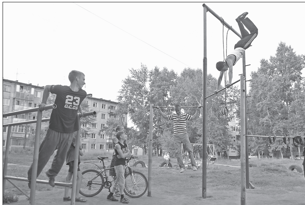
Спортивный вечер в самом разгаре.