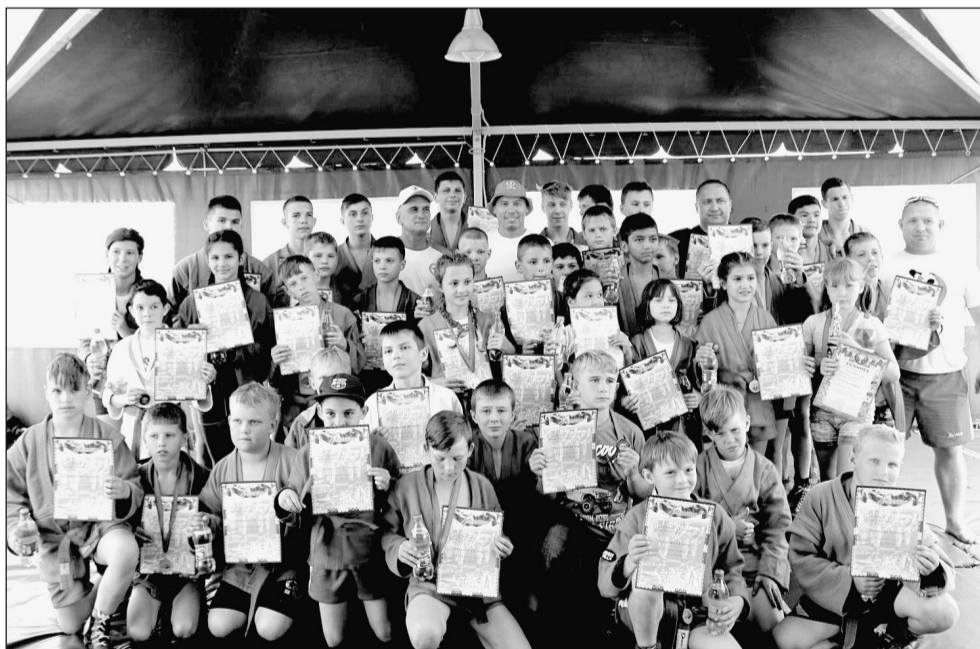
«Фестиваль на Завьяловских озерах», проходивший в июле, собрал на соревнования по самбо более 120 юношей и девушек со всего Алтайского края.

И вот в 2012 году с приходом нового главы админи-